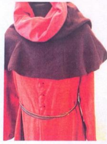
SUKNIA ŚREDNIOWIECZNA GRANATOCZERWONA NR 4 granatoczerwona suknia wierzchnia jaszczyczerwony kaptur czarny pasek