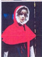
SUKNIA ŚREDNIOWIECZNA GRANATOWA NR 9 ✓ - granatowa suknia wierzchnia ✓ - biała suknia spodnia ✓ - czerwony kaptur