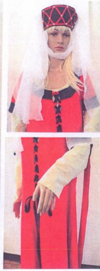
SUKNIA ŚREDNIOWIECZNA CZERWONA NR 6 ✓ - czerwona suknia wierzchnia ✓ - jasnozielona suknia spodnia ✓ - nakrycie głowy ✓ - dwa welony prostokątne