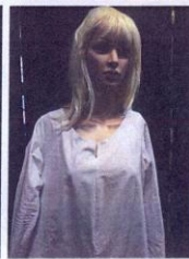
SUKNIA ŚREDNIOWIECZNA BŁĘKITNA NR 11 ✓ - błękitna suknia wierzchnia ✓ - biała suknia spodnia ✓ - nakrycie głowy ✓ - biały, okrągły welon