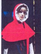
SUKNIA ŚREDNIOWIECZNA GRANATOWA NR 9 ✓ - granatowa suknia wierzchnia ✓ - biała suknia spodnia ✓ - czerwony kaptur