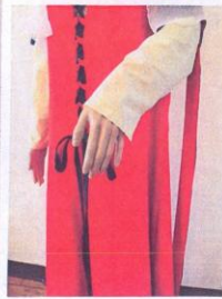
SUKNIA ŚREDNIOWIECZNA CZERWONA NR 6 ✓ - czerwona suknia wierzchnia ✓ - jasnozielona suknia spodnia ✓ - nakrycie głowy ✓ - dwa welony prostokątne